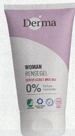
Oczyszczający żel do twarzy, Derma , ok. 40 zł